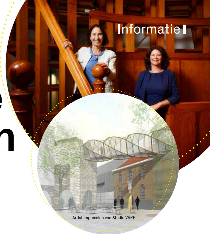
Artist impression van Studio VVKH

Deze studio past naadloos bij onze visie. In onze visie stellen we immers dat: ‘In een samenleving waarin wetenschappelijke en technologische ontwikkelingen steeds sneller gaan, wij het zien als onze opdracht om mensen hierbij te betrekken en te laten zien waar deze ontwikkelingen vandaan komen. Zo ontstaat er meer begrip van wetenschap en de bijzondere prestaties van onderzoek en innovatie.’