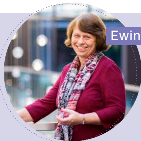
Ewine van Dishoeck

“Rijksmuseum Boerhaave vervult een unieke rol door de wetenschap van vroeger direct te verbinden met de laatste spannende resultaten. Het was een eer voor mij om curator te zijn van de Kosmos: Kunst en Kennis tentoonstelling en samen te werken met de uitstekende medewerkers van het museum.”